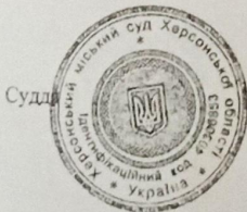
С. І. Майдан

Оплату здійснює ТУ ДСА в Херсонській області.